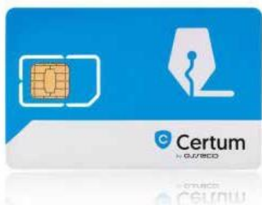
Zestaw cryptoCertum MINI bez czytnika

Karta Certum jest wymieniona na stronie www.cepik.gov.pl jako spełniająca wymagania techniczne.