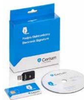
Zestaw cryptoCertum MINI z czytnikiem USB